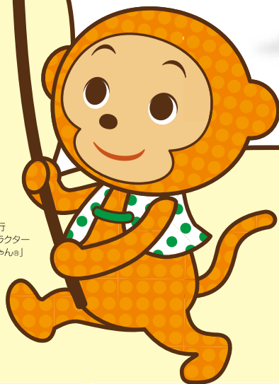
八十二銀行 オリジナルキャラクター 「はちの8ちゃん」

八十二銀行グループは、 全役職員が主体的に地域の課題解決に取り組み、 地域の皆様とともにSDGsが目指す持続可能な社会の 実現に努めてまいります。