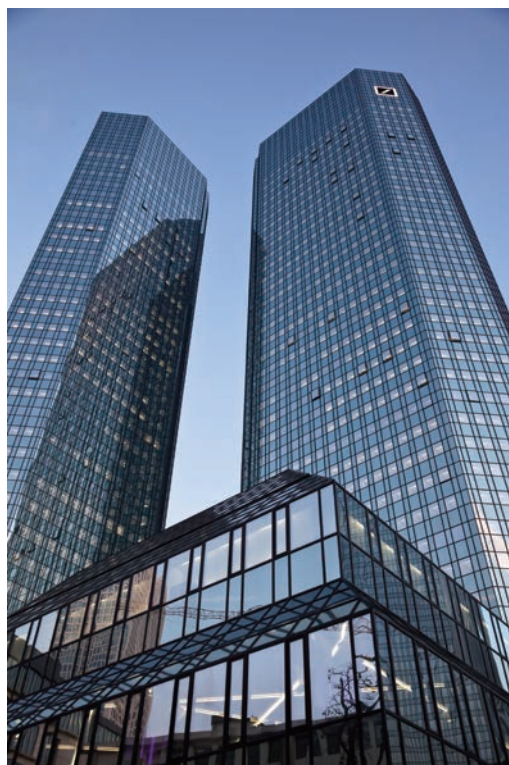
ドイツ銀行本社(ドイツ・フランクフルト)